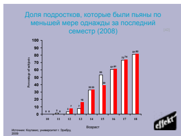
Схема 1. Количество (%) подростков разного возраста, которые указали, что были пьяны по меньшей мере однажды за последний семестр. (Коутакис, 2009)

Диаграмма показывает типичную ситуацию в средних классах шведской школы. Таким образом дела обстоят в большинстве шведских населённых пунктов. В 7-м классе почти 20% мальчиков и около 15% девочек бывали пьяны. В 8-м классе – 25% у мальчиков и 22% девочек. В девятом классе происходит резкий скачок вверх, показатели удваиваются, и девушки догоняют юношей. В 9-м классе больше половины школьников когда-либо бывали пьяны.