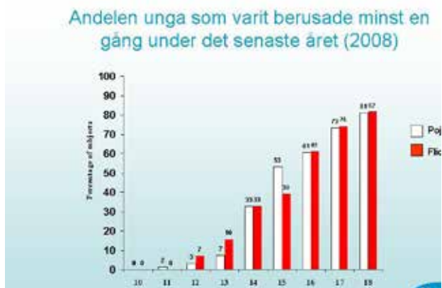
Схема 1. Процентная доля учеников различных классов, указавших, что они были пьяны по меньшей мере однажды за прошедший год. На вертикальной оси – проценты, на горизонтальной – возраст учащихся. Белый цвет – мальчики, красный цвет – девочки.

Старшеклассники часто напиваются. Это происходит чаще, чем родители в целом могут себе это представить.